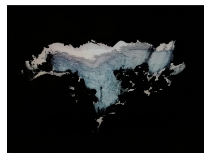
Javier Vallhonrat, Simulación de simulación #2 y Simulación de simulación #4 , fotografías, 2016.