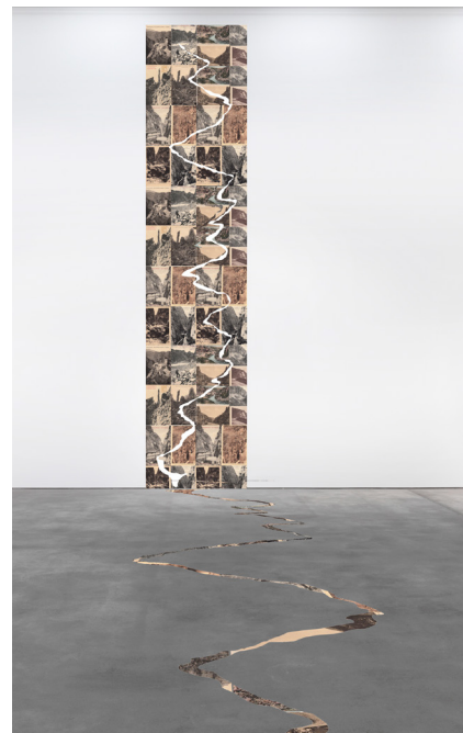
François Vanneraud, Un paisaje nunca es inocente , instalación postales antiguas, 2022.