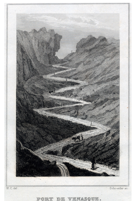
Port de Venasque. Grabado por Schroeder, 1838. Fondos de la Fundación Hospital de Benasque

La nueva sala de exposiciones y conferencias en su sede en Llanos del Hospital, ha impulsado el desarrollo de nuevas actividades, incluyendo exposiciones de artistas contemporáneos que trabajan en el Pirineo.